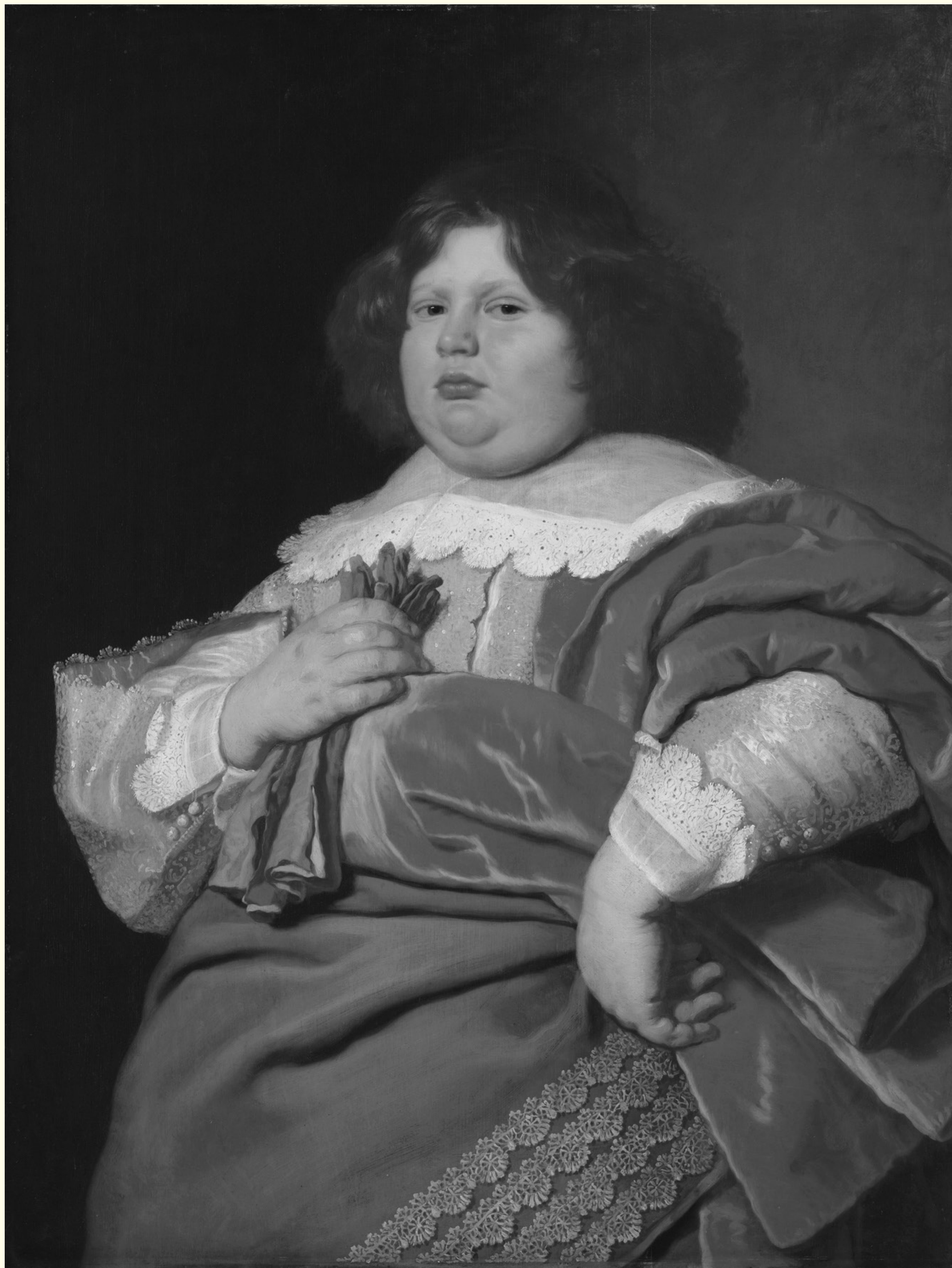
Gerard Andriesz Bicker (1622-66), heer van Engelenburg. Drost van Muiden, Bartholomeus van der Helst, 1640