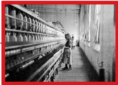
Werkneemster in katoenfabriek in Carolina – 1908