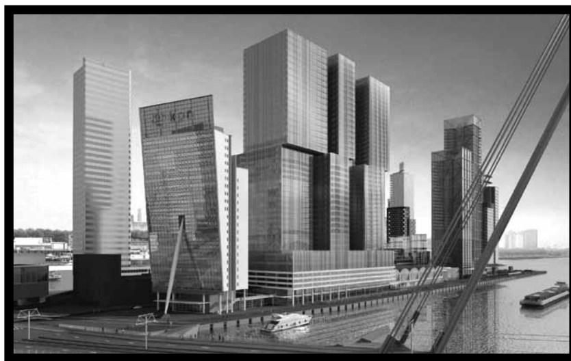
© OMA (Office for Metropolitan Architecture) van Rem Koolhaas

in Dordrecht. Een Portugese chef maakt maaltijden voor ze in de bouwkeet achter het bouwterrein van De Rotterdam. De Turken vlechten het ijzer voor het gewapende beton. De Nederlanders leveren o.a. stukadoors en elektriciens. Er werken ook Duitsers, Engelsen, Spanjaarden en Italianen en de voertaal blijft Nederlands. Ze verstaan elkaar niet altijd maar de universele taal van het bouwen wordt begrepen. De betrokkenheid bij deze constructieve uitdaging is groot. Het gebouw is van iedereen die er aan werkt. 'Straks is het gebouw af en dan kijken we naar een mooie glasgevel. Het gebouw zal worden bewonderd maar achter die huid van glas zit een casco van beton en staal, gemaakt door mensenhanden', zegt Ruud Sies. Hij merkt dat zijn foto's, worden gewaardeerd door de werklui. Hier zijn dezelfde heroïsche mensen aan het werk met hun inzicht en inzet. De foto's van Ruud Sies liggen in het verlengde van de foto's die Hine maakte van de Empire State Building. Een nieuwe recessie heerst, een nieuw gebouw rijst op in de stad. Het is mogelijk om iets groots tot stand te brengen ondanks de economische recessie. Dit is te danken aan het vakmanschap en de samenwerking van de arbeiders.