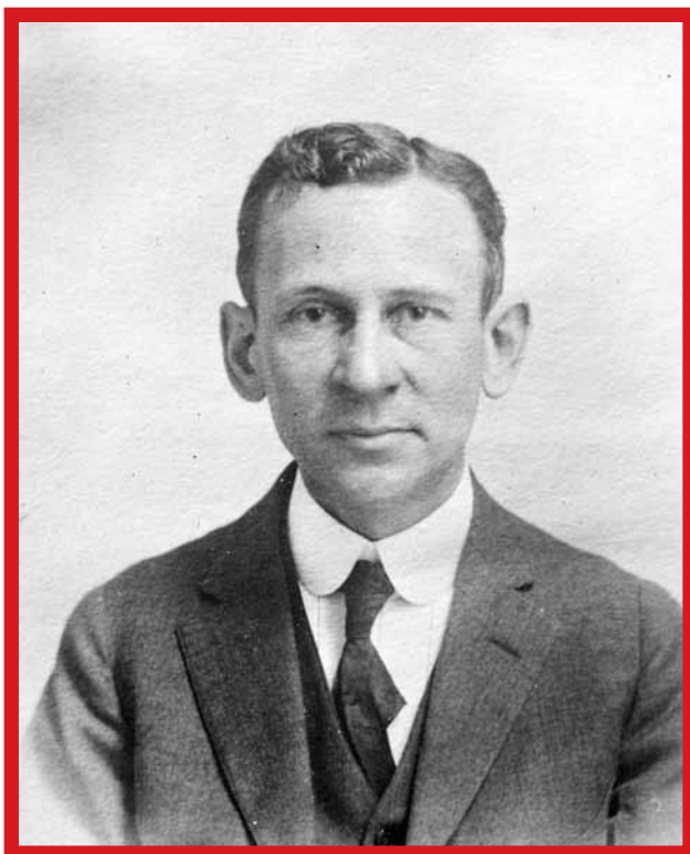
Portret van Lewis Hine – ca. 1917

“If I could tell the story in words, I wouldn't need to lug around a camera.”