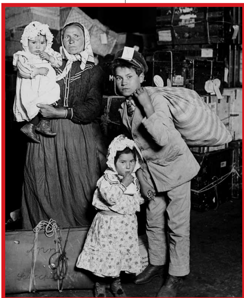
Italiaanse familie op zoek naar verloren bagage, Ellis Island – 1905

Ieder verhaal was er één. Ieder individu telde mee. Een foto liet zien hoe de nieuwkomers de trappen opliepen en letterlijk Amerika in klimmen. Waar woorden ophielden, vertelde de foto het verhaal van de migranten verder. Welke blikken zien we in de ogen van de mensen die niet weten wat hun te wachten staat? Is het een mengeling van opwinding en onzekerheid? Hoe zouden we die blikken omschrijven?