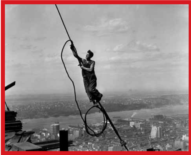
Icarus bovenop Empire State Building – 1931

Dit boek wordt in 1932 gepubliceerd en is speciaal bedoeld voor kinderen. We horen de stem van een leraar in de korte bijschriften bij de foto's. Hij begint zo: 'Dit is een boek over mannen aan het werk; mannen van moed en ambacht en verbeeldingskracht. Steden bouwen niet zichzelf, machines kunnen geen machines maken...'. Het boekje bejubelt de mens die in staat is met behulp van machines grote bouwwerken te maken. Hine benadrukt het esthetische als hij vertelt hoe trots hij is op het hoogste gebouw van Amerika. Het sociale wordt belicht wanneer hij vertelt over de stof die een man inademt tijdens het werk en hoe dat zijn leven verkort. Herhaaldelijk stelt hij vast dat machines ondergeschikt blijven aan de geest van de mens: De menselijke geest is het belangrijkste.