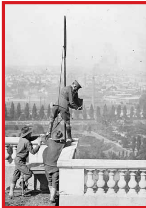
L. Hine, officiële fotograaf van het Amerikaanse Rode Kruis tijdens de oorlog, Parijs – 1918

Ze werden gemaakt om te kunnen worden gereproduceerd. De reproductie werd vaak op lage kwaliteit papier gemaakt, zelfs krantenpapier werd gebruikt. De inkt die men gebruikte was niet van de beste kwaliteit en zeker niet dezelfde die men gebruikte voor de editie van een kunsttijdschrift. Het ging Hine om de indringende waarheid. Als die waarheid moest worden verteld, lagen zijn foto's klaar. Zijn foto's ontstonden niet onder druk van een deadline maar door zijn grote sociale betrokkenheid met zijn onderwerpen. Er lijkt een andere deadline een hoofdrol te spelen in het werk van Hine.