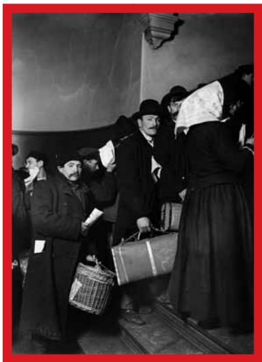
Ze zetten hun eerste stap in Amerika, Ellis Island – 1905