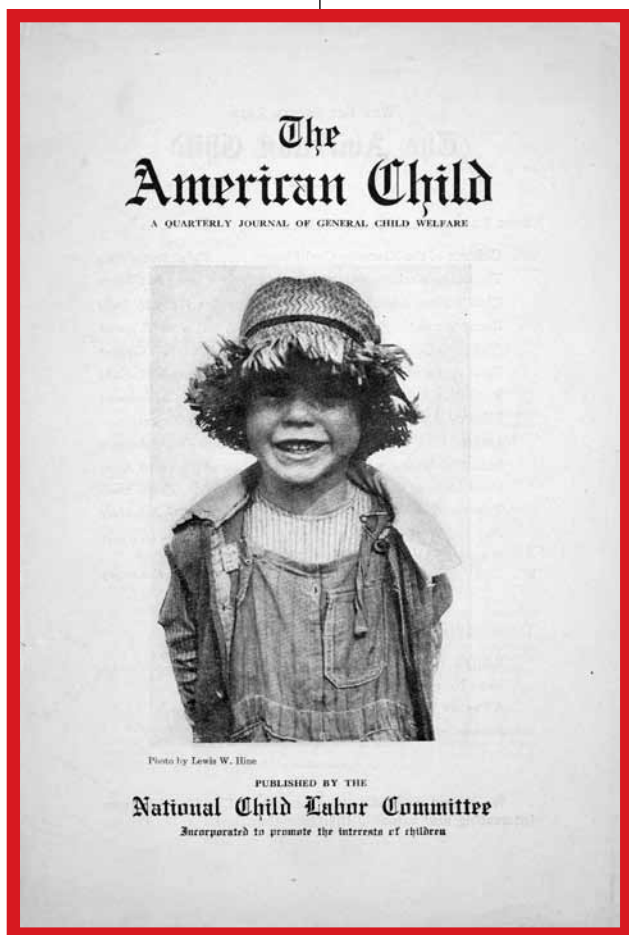
The American Child – 1924

Hine beschreef zichzelf als een lichtgewicht. De camera die hij in de begintijd gebruikte was een platencamera. Die was zwaar om te tillen. Als je een verticale compositie wilde maken moest je de doos eerst los draaien, kantelen en daarna weer vast draaien. Hij gebruikte glasplaten. Voor iedere foto was één glasplaatje nodig. Behalve de zware camera, droeg hij nog een tas met al die glasplaatjes. Hij sjuowde dus heel wat met zich mee als hij op pad ging.