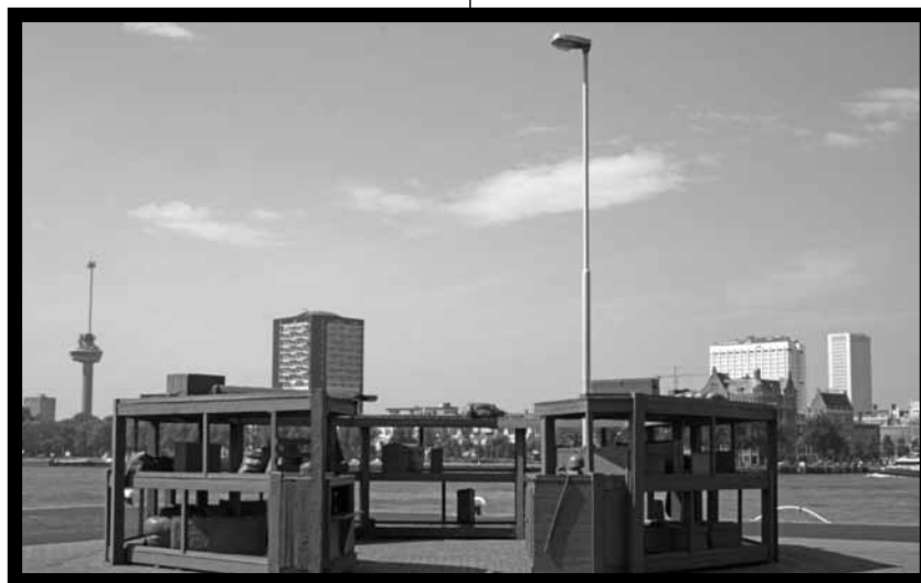
Jeff Wall, Lost Luggage Depot, Rotterdam - 2001.

bestemming. Het prachtige hoofdkantoor van de Holland Amerika Lijn staat er nog. Het is een viersterren Hotel geworden met een Grand Café. Waar de terrassen bij hotel New York op een zomerse dag vol zitten met mensen die wachten op hun ice-tea of glas wijn, de kinderen likken aan een ijsje, stonden ooit mensen met hun handbagage te wachten. In de periode tot de Eerste Wereldoorlog vertrokken grote aantallen Oost-Europese landverhuizers via de Wilhelminakade naar New York. Men hoopte op beter werk en liet bekenden en familieleden achter. Het moet een drukte zijn geweest op de pier. Drukke van mensen die vertrokken en mensen die achterbleven, mensen die huilden en die zich groot hielden, mensen die elkaar vastpakten en mensen die onwennig 'dag' tegen mekaar zeiden. Van mensen die zwaaiden en mensen die een laatste glimp van iemand zagen toen het schip eindelijk uitvoer.