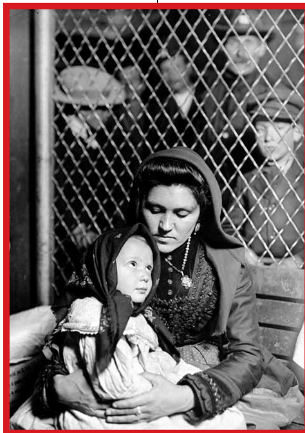
Italiaanse Madonna, Ellis Island – ca. 1905

Men dacht dat deze groepen Italianen, Joden en Russen gevaren met zich mee brachten. Die argwaan was gebaseerd op onvoldoende kennis, vond Hine. De werkelijke feiten waren belangrijk. Men zou het kijken kunnen ontwikkelen door zorgvuldiger met de ogen waar te nemen. Hier zien we de rode draad die Hine oppakte en niet meer losliet tijdens zijn leven. Hij geloofde in de kracht van het zien. Hij geloofde in de overtuigingskracht van het beeld. Daaraan werd de schoonheid van het beeld ondergeschikt gemaakt. Om maatschappelijke problemen op te lossen moesten ze zichtbaar worden gemaakt. Die rol was weggelegd voor de fotografie, volgens Hine. Dat was nieuw in die tijd.