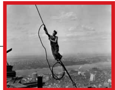
Icarus bovenop Empire State Building – 1931