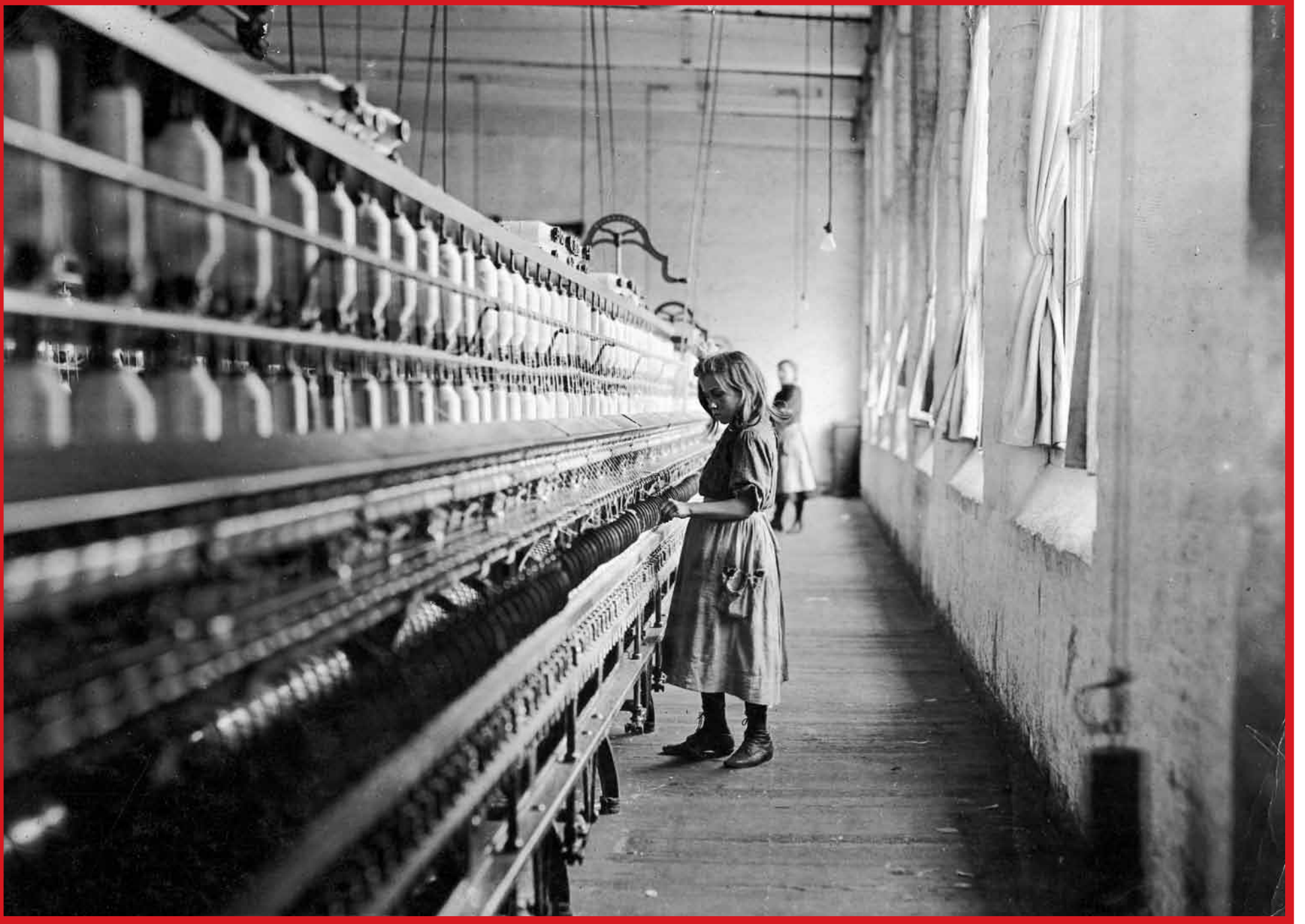
Werkneemster in katoenfabriek in Carolina – 1908