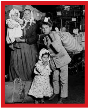
Italiaanse familie op zoek naar verloren bagage, Ellis Island – 1905